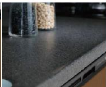
空間全体を引き締める 御影石のようなブラック仕上げ