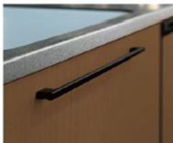
キッチンにアクセントを加える マットで適度な取手デザイン