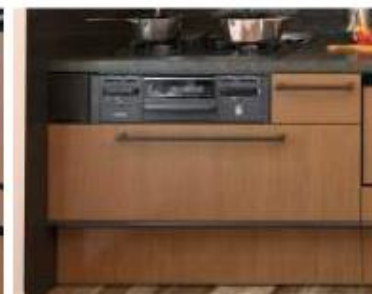
コンロ横引き出しはブラック色

期間限定で、Bbスタイリッシュプランのキッチンに、浄水器内蔵ハンドシャワー水栓を無償プレゼントいたします！ ※対象期間：2019年3月末まで