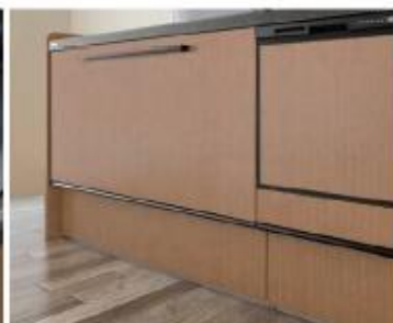
フロア材との相性が良い フロアスライド部分も黒調一仕上げ